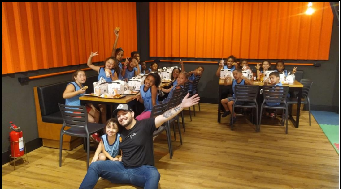
Festival de Judô- 29/10