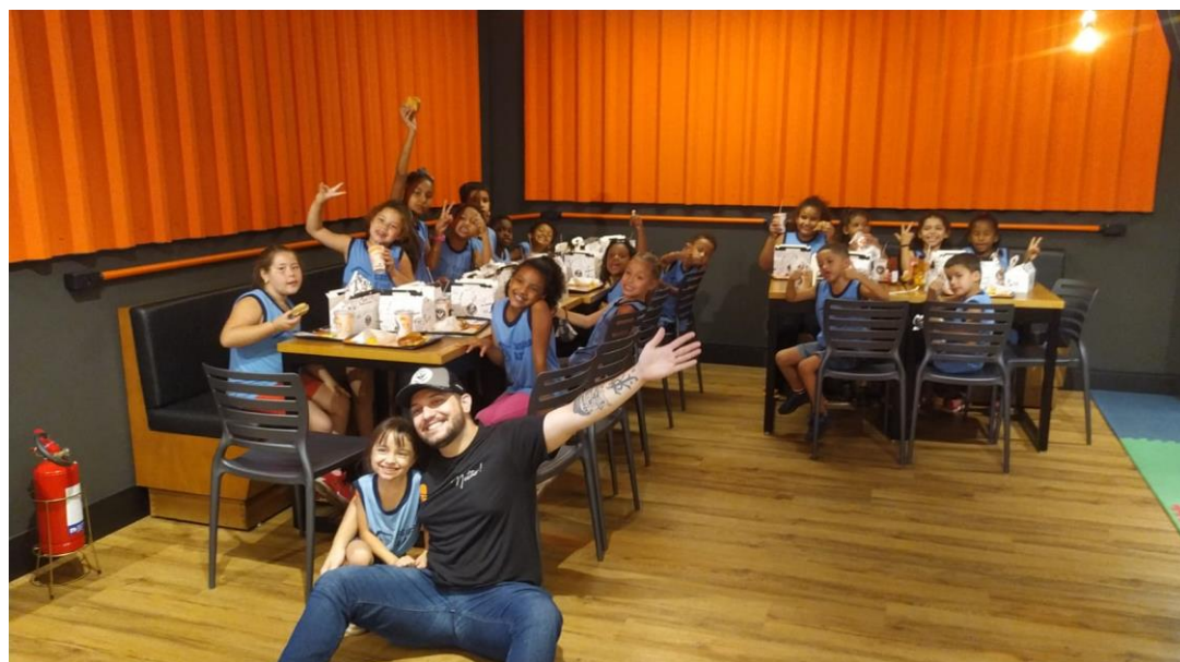
Festival de Judô- 29/10