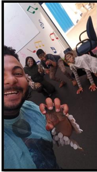
- Festa da Simplicidade; (30/06)